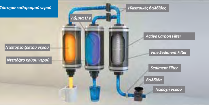
Σύστημα καθαρισμού νερού

Το φίλτρο ενεργού άνθρακα (Active Carbon Filter) απορροφά όλες τις ακαθαρσίες και οσμές του νερού και είναι αποδεδειγμένα ο καλύτερος τρόπος φιλτραρίσματος. Τα T6, T7 και το TS PLUS έχουν πιο μεγάλη επιφάνεια φίλτρου με πολύ καλύτερα αποτελέσματα καθαρισμού του νερού με αποτελέσματα όπως τον εξαφανισμό του χλωρίου και καθαρισμό σωματιδίων μέχρι και 0.0006 μιλίμετρα.